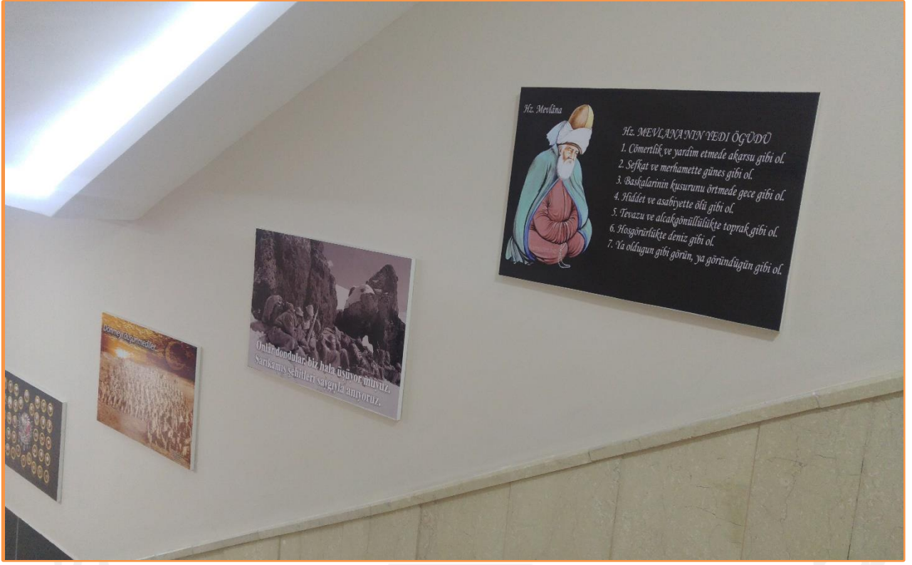
Resim 8: GÜVEN TOPLUMU : DİĞER