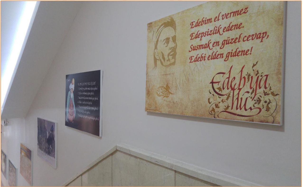
Resim 7 : GÖRGÜ KURALLARI : DİĐER