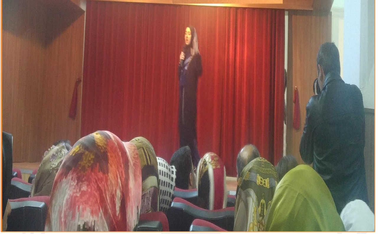
Resim 4: GÖRGÜ KURALLARI – YARIŞMA