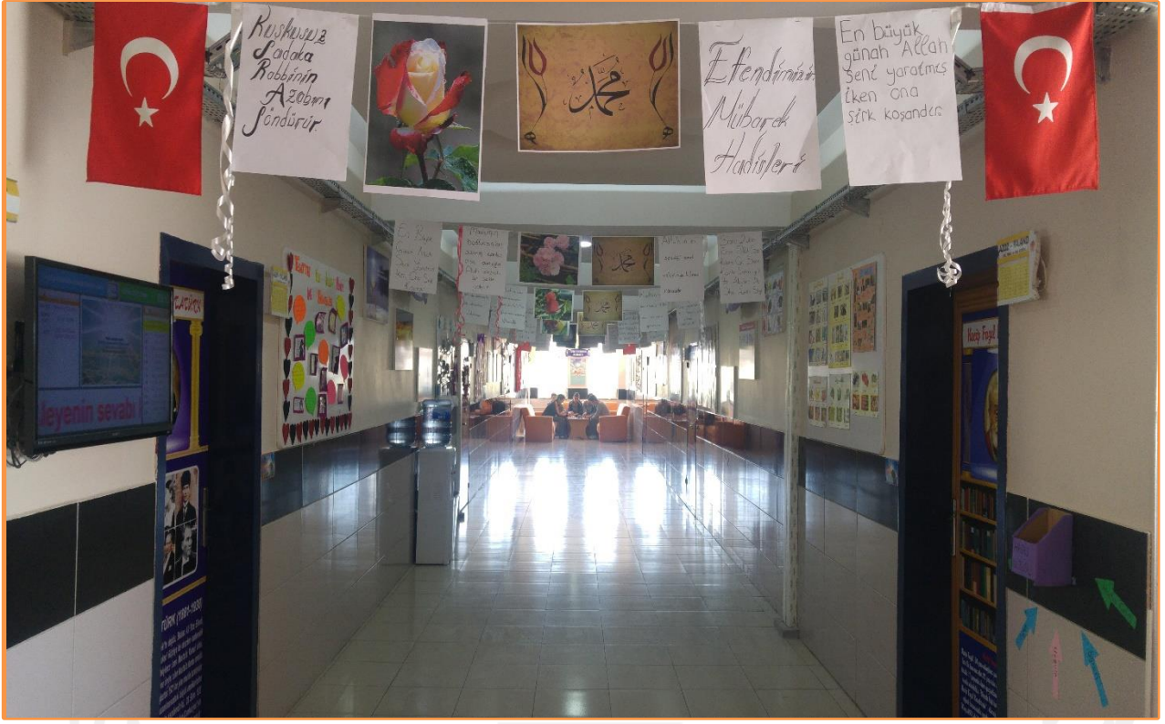
Resim 2: GÖRGÜ KURALLARI: GÖRSEL SUNUMLAR KORİDORLARIMIZDA PEYGAMBER EFENDİMİZİN HADİSLERİ