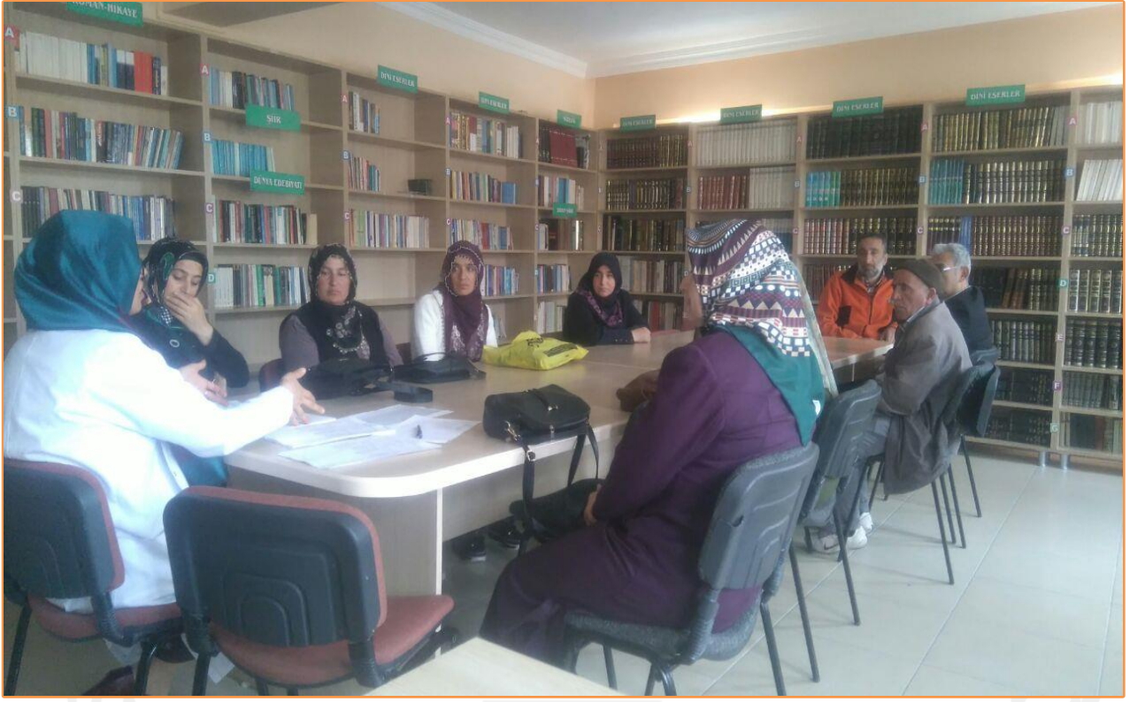
Resim 6 : GÖRGÜ KURALLARI : ANNE BABA EĐİTİMİ VE VELİ SEMİNERİ